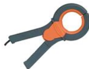
HT97U, токовые клещи - преобразователь