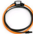
HTFLEX33E, гибкая токовая петля для измерений