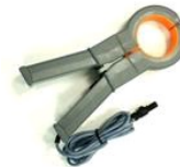
HT98U, токовые клещи - преобразователь